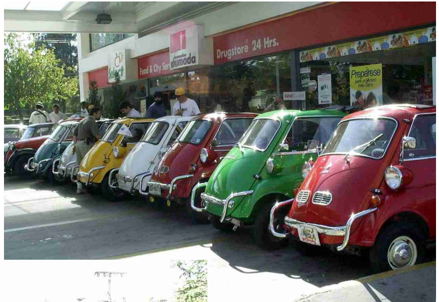
Borderrío en Monseñor Escrivá de Balaguer.